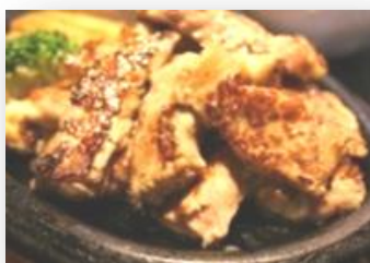
ビーフカットステーキ