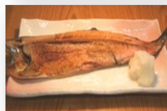
サクラマス一夜干し