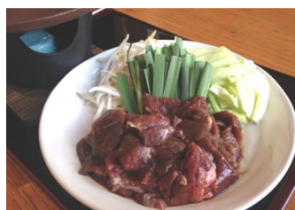
鹿肉のジンギスカン 陶板焼き