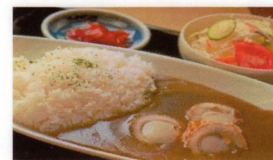
⑦ホタテカレー イメージ