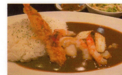
⑥シーフードカレー イメージ