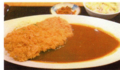
②カツカレー イメージ